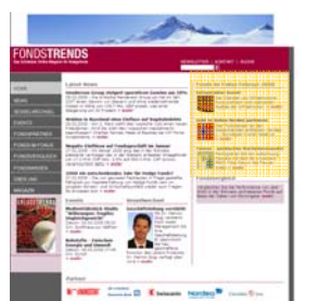
Fonds im Fokus im monatlichen Wechsel