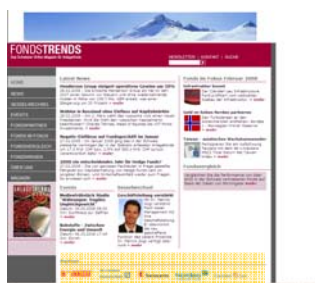
Logo in der Partnerspalte

Beraterkommission 5 %, die Preise sind ohne MwSt